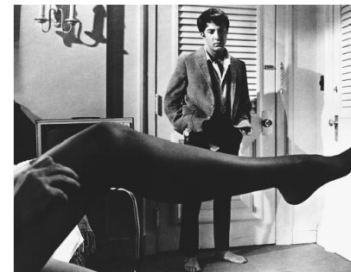
The Graduate 1967