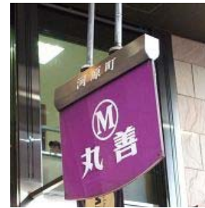
日本河原町駅(京都) 付近のカラオケの検索結果

というのも偏見かもしれませんが、2005年10月10日、丸善京都店が昭和15年開店以来65年の歴史に終止符を打ち、ビルはそのまま全館がカラオケ館になったのは、時代の流れといえども、中年以上の世代にとっては寂しいものです。