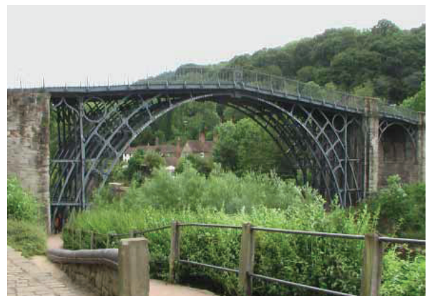
図 14 文字どおりの Ironbridge