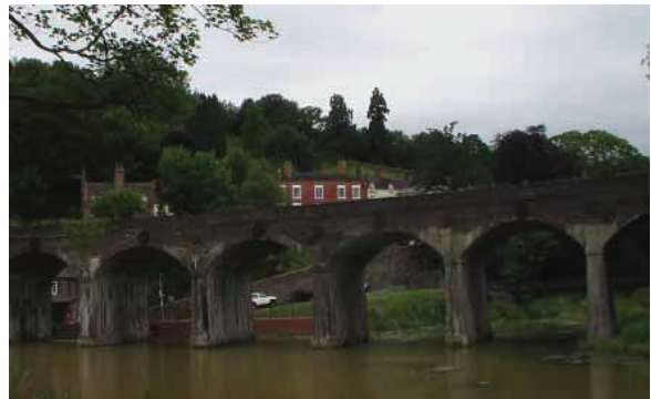
図 9 Darby Furnace の裏手にある池