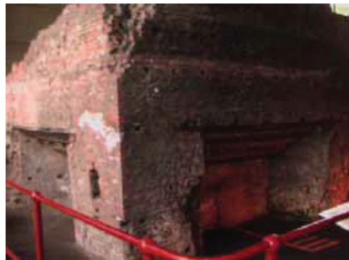
図 8 Darby Furnace

図 7 Darby Furnace の納められた建物 三角形の建物の高さは 10m 程度ある (筆者が以前にインターネット上の写真で見っていたときは, 人の背丈程度と誤解していたので念のため.)