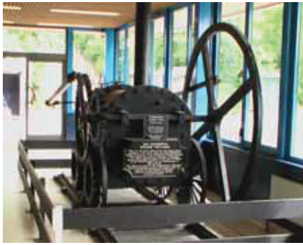
図4 Telford Central 駅に展示されている Richard Trevithick の蒸気機関車 (1803)

Central 駅構内には、図4のような Richard Trevithick の蒸気機関車が展示してあり、早くも産業革命の雰囲気を感じさせる。