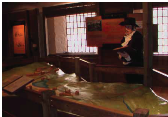
図 10 Museum of Iron の内部 (1)