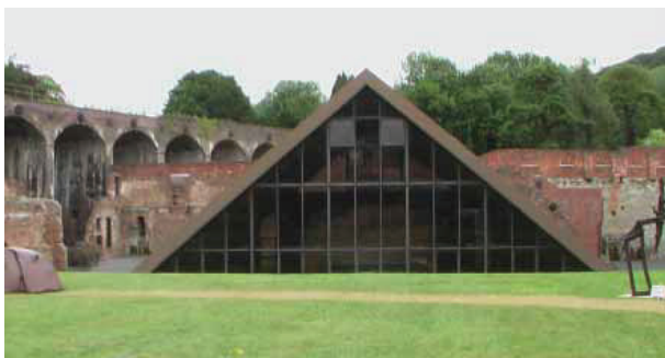
図 7 Darby Furnace の納められた建物 三角形の建物の高さは 10m 程度ある (筆者が以前にインターネット上の写真で見っていたときは, 人の背丈程度と誤解していたので念のため.)