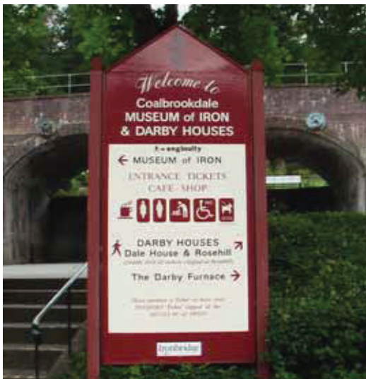
図 6 Ironbridge Gorge の入り口に立っている看板

Darby Furnace と 200m くらい離れて反対側に向き合っている時計台付きの建物が, Museum of Iron である. おみやげ屋とカフェを兼ねた比較的小さな 1~3 階のスペースに 18 世紀の Ironbridge の様子を再現するとともに, Darby Furnace の模型なども陳列されている (図 10, 11).