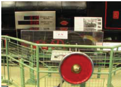
図 12 Enginuity にある蒸気機関車移動ゲーム