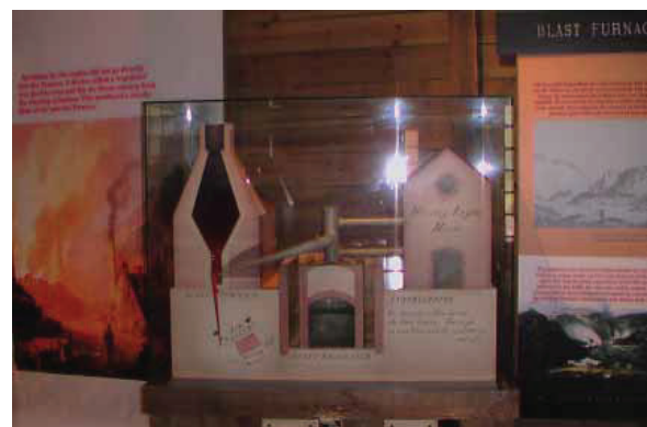
図 11 Museum of Iron の内部 (2)