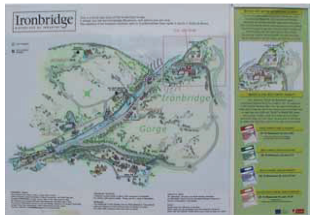
図5 Ironbridge Gorge の地図