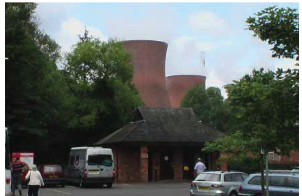
図 13 Musium of Gorge のそばの火力発電所

Museum of Gorge を出て川沿いに 500m ほど登ると、右手にこの地域の象徴でもある文字通りの Ironbridge が現れる (図 14)。これは Thomas Farnolls Pritchard が 1775 年に設計し、Abraham Darby III が尽力して 1779 年に完成したものである。世界初の鉄製の橋であり、スパン長は 30.6m、使われた鉄は 380 トン。この地域だけでなく産業革命の象徴である。明石海峡大橋 (主塔高さ海面上約 298m) やフランスのミヨー大橋 (The Millau Viaduct : 地上より橋塔の高さ 343m) のような巨大な橋も見慣れてしまった現代人にとっては小さく映るが、当時の鉄の生産量から考えれば巨大プロジェクトであったことは想像に難くない。なお、この橋を渡ってすぐ右側にインフォメーションセンターがあり、さらに上流川に向かえば Jackfield Tile Museum や Coalport China Museum もある。