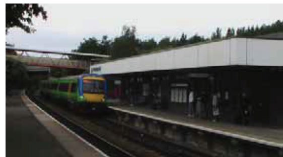
図 3 Telford Central 駅と Birmingham 行き列車

約 30 分で Telford Central 駅に至る (図 3)。Telford