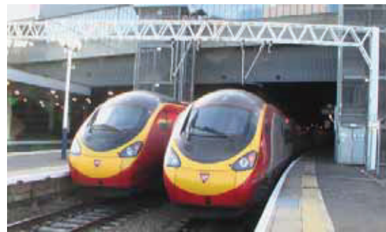
図 2 Euston 駅からの高速列車