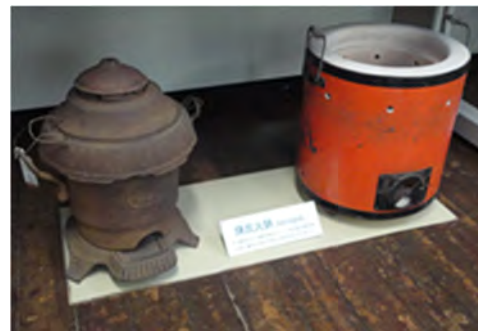
図 9 温暖飼育に用いた練炭火鉢

蚕種製造関連では産卵枠および蚕種紙(蚕卵台紙), 種繭雌雄鑑別器, 顕微鏡(蚕病理検査用)など, 稚蚕飼育関連では掃きたて紙, 桑刻み包丁など, 養蚕関連ではわらだ, 練炭火鉢(図 9), 桑摘み爪, 給桑台など, 上簇関連では伊達まぶし, 回転まぶし, まぶし折り機など, 生糸・真綿製造関連では繭煮鍋, 座繰り器, ぼうず(真綿引き伸ばし用陶形)など, 機織関連では機織り機, 杼, 糸車などが収蔵されており, 一部は整理されて展示・公開されている。これらの伊達市所有の幕末期から昭和期に使用された養蚕関係用具 2530 点は「伊達地方の養蚕関係用具」として平成 20 年 3 月 13 日付けで国登録有形民俗文化財に登録されている。その登録の数量からも伊達の養蚕業がいかに日本の養蚕業をリードして発展を遂げてきたか, 多くの新たな知見を得ることとなった。