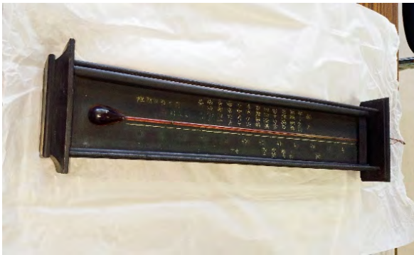
図 10 蚕当計（岡谷蚕糸博物館蔵）

り大きく、木枠の長さは約 50cm である。製作年代は、明治初期と記録されている[7].