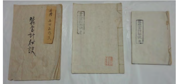
図5 『蚕当計秘訣』真筆ならびに版本

4年 改正再刻」の文字が確認できる。この1864（文久4）年に積玉堂より発行された再刻改正版が、世の中に広まったものと考えられる。