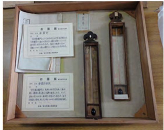
図3 蚕当計（1849年頃） （泉原養蚕用具整理室）