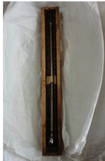
図4 蚕当計原器（泉原養蚕用具整理室）

「蚕当計」の枠材質は桐製で壁掛けタイプとなっている。大きさは、一方は W54mm×L300mm×t18mm、他方は W52mm×L318mm×t20mmである。目盛りは華氏の1°F刻みで、液溜まりの丸みには製品ごとにばらつきが確認される。現存のもの的一方は取り外し可能なガラスで表面が覆われているが、他方はガラスで覆われてはいない。「蚕当計」の左下には『中村善右衛門製』の印、左上にも社判らしき印が押印されている。一方の「蚕当計」には旧暦の正月から12月まで、他方の「蚕当計」には24節季が、それぞれガラス管の左側に気温の高低順に表現されている。また、一方の「蚕当計」の板面が若干明るいことから、他方の蚕当計の標記に改良を加