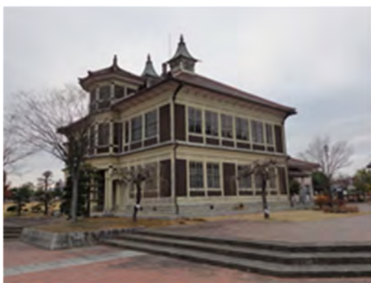
図 8 国指定重要文化財 旧亀岡住宅

図 8 の写真は, 国指定重要文化財に指定されている「旧亀岡家住宅—明治の木造擬洋風建築—」である。この建物は 1904 (明治 37) 年頃に伊達郡で蚕種製造業を営んでいた亀岡正元によって建てられた建造物で, この時代の農家住宅としては稀な擬洋風の建築である。総二階建の座敷棟に立つ二つの尖塔と飾り煙突, 八角形の塔屋に洋風の特徴を有している。一方, 内部の大部分は純和風の座敷で, 廊下との間仕切りには当時としては珍しいガラス戸が用いられており, 東日本大震災でも破損は全く見られなかったそうである。この旧亀岡家住宅からも, 「奥州蚕種本場」, すなわち蚕種(蚕の卵)を全国に供給する産地として栄えた当時の栄華を窺い知ることができる。