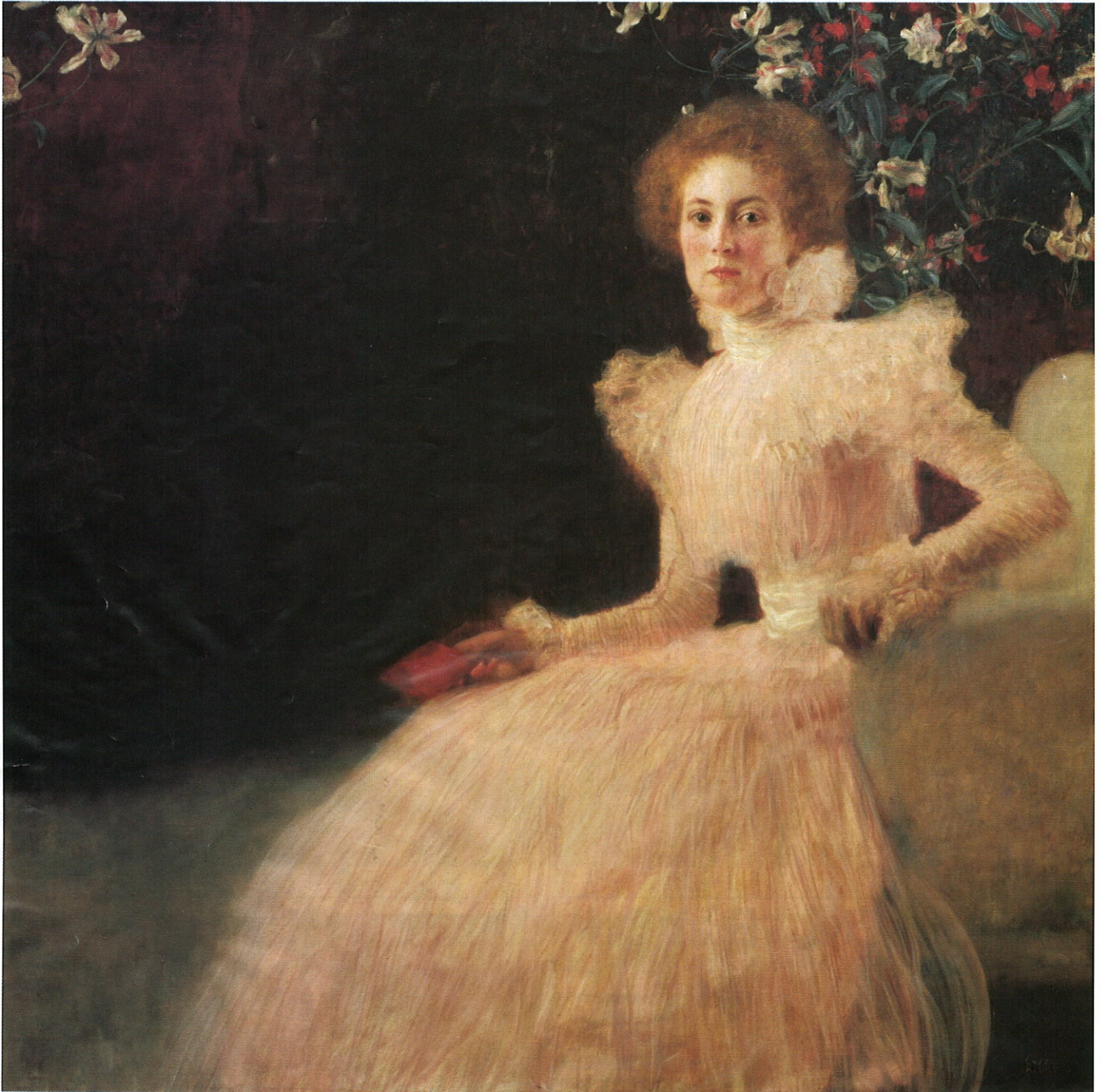
Gustav Klimt Sonja Knips, 1898 Öl auf Leinwand Belvedere, Wien

グスタフ・クリムト『ソーニャ・クニプス』1898年 カンヴァスに油彩 ベルヴェデーレ（ウィーン）所蔵 ベルヴェデーレ上宮における特別展「グスタフ・クリムトと芸術家仲間たち」にて10月2日まで展示