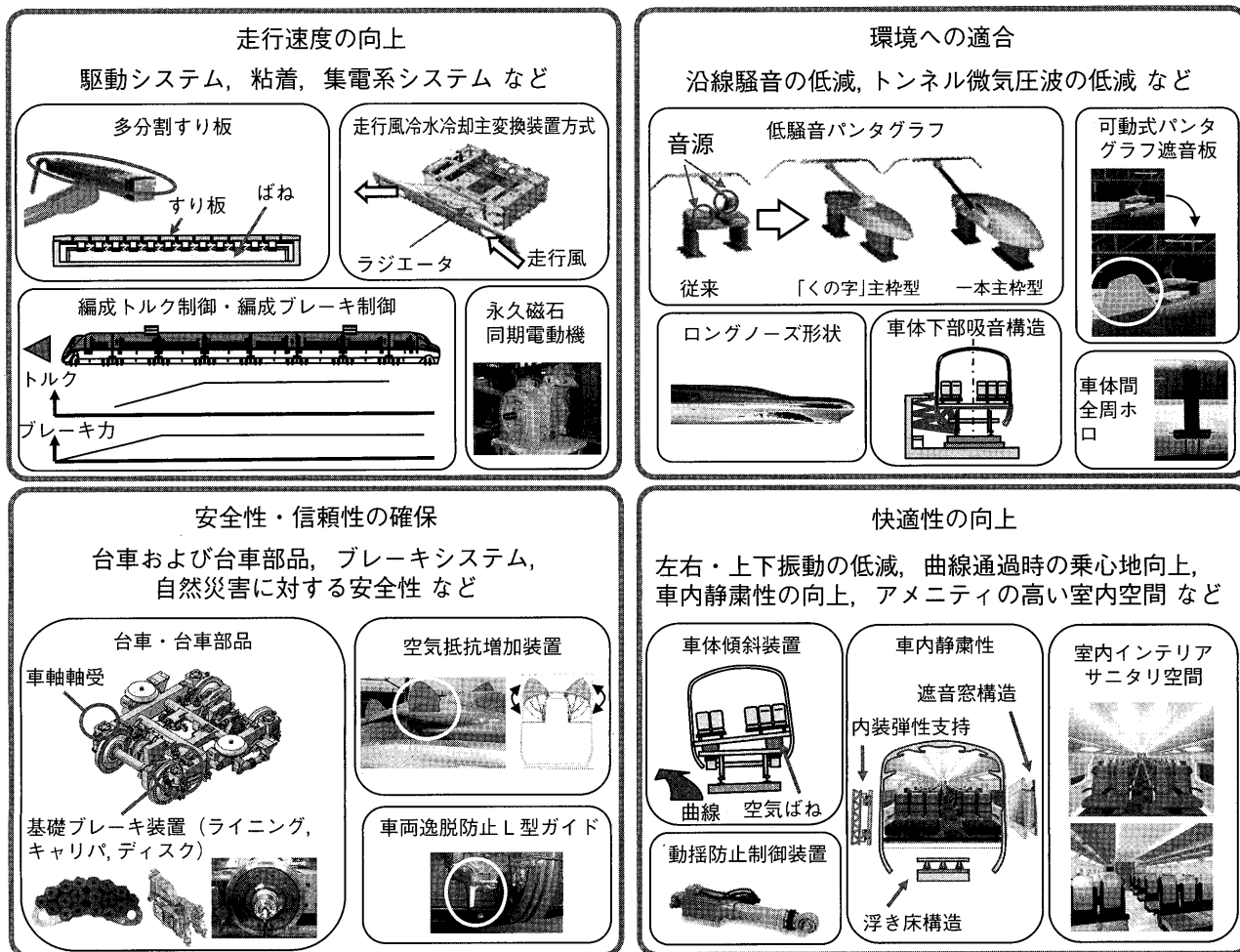
図2 FASTECH360による技術開発例